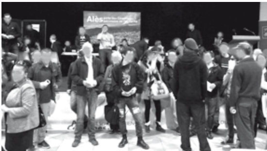
Tract distribué au Forum de l'emploi saisonnier, Espace Jules Cazot, Alès - 14/04/16